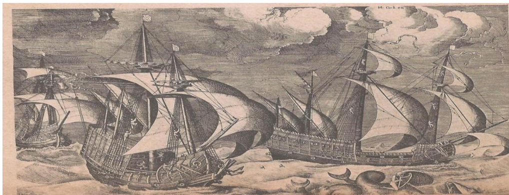
Les Caravelles, (d'après Brueghel).

Après les côtes du Sénégal et de la Guinée, les Portugais atteignent en 1471 l' Equateur . Enfin en 1488 , Barthélemy Diaz double le cap de Bonne-Espérance et, 10 ans plus tard, Vasco de Gama remonte la côte orientale d'Afrique, entre en contact avec les Etats musulmans et, dirigé par un pilote arabe, arrive aux Indes ( 1498 ).